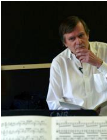
Philippe Hersant était nommé aux Victoires de la musique classique.

« À mesure que ma vie devenait, au fil des ans, de plus en plus sédentaire et citadine, j'ai senti grandir en moi une fascination pour les récits de voyages et les road-movies , pour les écrits nomades de Nicolas Bouvier ou les haïku du poète-voyageur Basho (ce dernier m'ayant inspiré les Ephémères pour piano). J'ai conçu plusieurs de mes pièces récentes ( Cinq Miniatures pour flûte, Chants du Sud pour violon) comme de minuscules voyages imaginaires dans de lointaines contrées (Afrique noire, Sahara, Chine, Japon) où je n'ai jamais mis les pieds... »