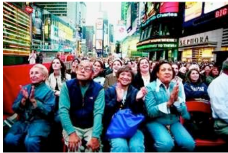
Madama Butterfly dans les rues de New-York

Dans son édition du 28 septembre, Le Monde a publié cette étonnante photo de New-Yorkais assistant à la retransmission de Madama Butterfly en pleine rue.