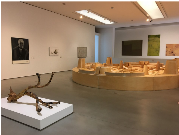
Niveau 2 du Cube, Le temps - La mémoire Vue d'ensemble

Georges Antoine Rochegrosse , quelques semaines avant le début de la Première Guerre mondiale, fait un constat dramatique sur son époque et sur l'art dans le grand tableau La Mort de la pourpre . Orphée gît, mort, asphyxié par l'atmosphère industrielle de l'arrière plan, sous le regard d'un poète éploré. Il dresse le portrait d'un monde qui disparaît, d'un passé qui se dissout dans le présent. Les couleurs, la lumière et la matière de cette peinture pourront être mises en relation avec le dispositif scénique de l'opéra.