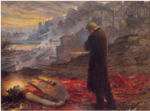
Georges Antoine Rochegrosse, La Mort de la pourpre , vers 1914

Georges Antoine Rochegrosse , quelques semaines avant le début de la Première Guerre mondiale, fait un constat dramatique sur son époque et sur l'art dans le grand tableau La Mort de la pourpre . Orphée gît, mort, asphyxié par l'atmosphère industrielle de l'arrière plan, sous le regard d'un poète éploré. Il dresse le portrait d'un monde qui disparaît, d'un passé qui se dissout dans le présent. Les couleurs, la lumière et la matière de cette peinture pourront être mises en relation avec le dispositif scénique de l'opéra.