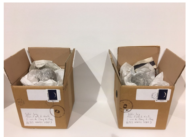
Dominique Blais, Révolution Synodique (correspondance) , 2018. Détail de l'œuvre